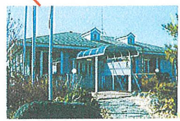
富士ドクタービレッジ 管理事務所

至富士吉田 河口湖LC ひばりが丘 交差点 国道139号 氷穴 紅葉台 至本栖湖