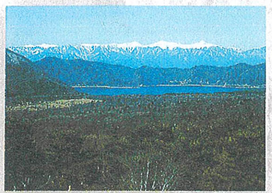
■樹海展望台からは南アルプスも一望

富士ドクタービレッジ村会活動 全てのオーナーさまには、富士ドクタービレッジ村会に入会いただいております。これは別荘地の健全な環境維持と、住民同士の親睦を深め、より快適な別荘ライフをお楽しみいただくための会です。住民の代表「村議員」を選出し、「村長」を決定し、ご要望やご意見を管理運営に反映しております。また、村会ではゴルフコンペやパーティーなどのイベントも企画し、住民同士の温かな絆を築いています。ビレッジの未来像はオーナーの皆さま一人ひとりによって、創られていくのです。